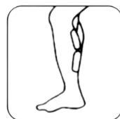
DOLNÍ ČÁST NOHY